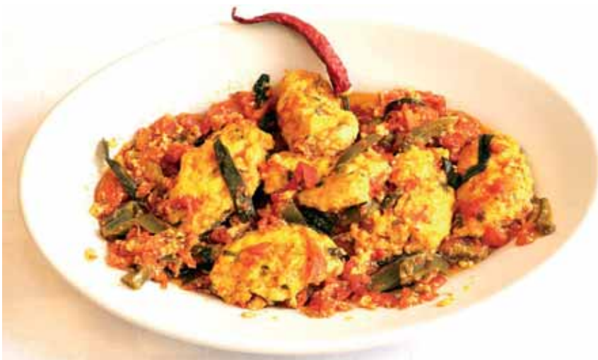
Pallotte cacio e uovo