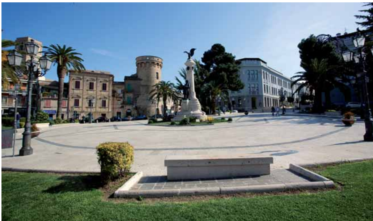
Vasto, Piazza Rossetti

tane e pedemontane, fatta di piatti semplici e saporiti, di carni ovine, zuppe e minestre, formaggi ed erbe aromatiche e la cucina marinara, che declina la varietà del pescato sposando il patrimonio di ortaggi e verdure delle colline a ridosso della costa. Piatto tipico e principe della cucina marinara è il brodetto alla vaste, una saporita zuppa di pesce colorata di pomodoro fresco che nasce per poter utilizzare tutta le varietà di pesce i scoglio che costituivano “la scafetta”, il piccolo cesto che il pescatore poteva far proprio. Oggi è un piatto speciale, che può includere frutti di mare, scampi, seppie, merluzzo, triglia, scorfano, palombo, razza e molte altre specie minori.