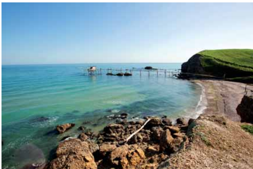
Vasto, Punta Aderci