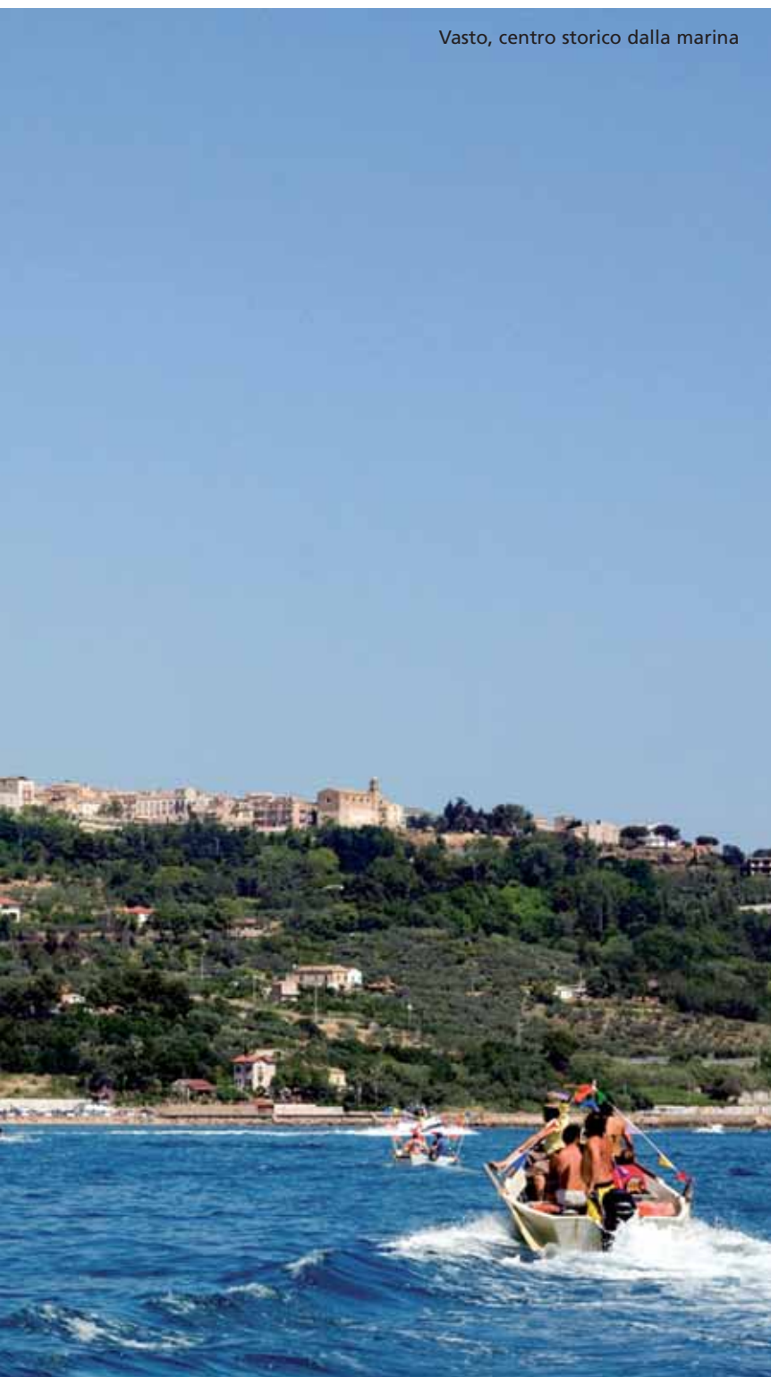
Vasto, centro storico dalla marina

Il comprensorio è costituito dai territori costieri di Vasto e San Salvo fino al lido di Casalbordino, e dai comuni del Medio e Alto Vastese