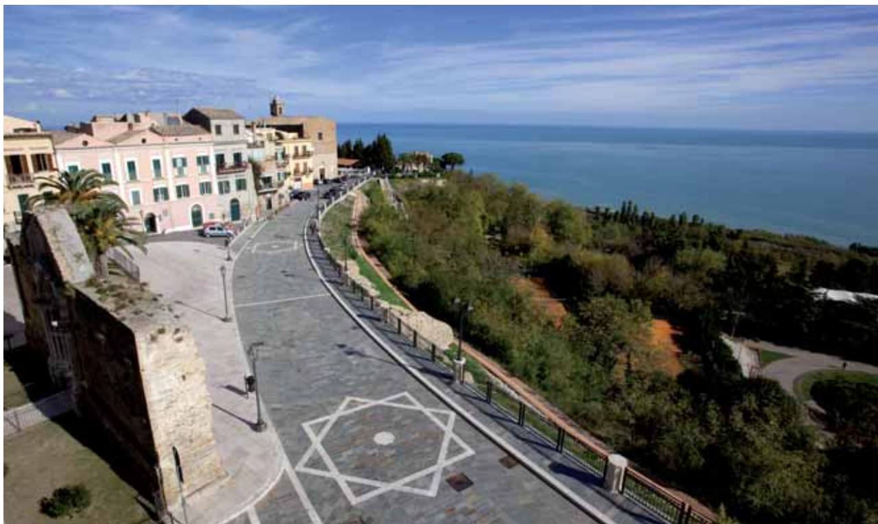
Vasto, Via Adriatica e passeggiata archeologica

ti porteranno allo scoperta di un territorio ricco di storia, natura e cultura.