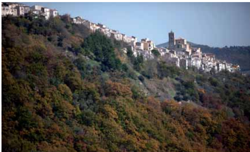
S. Buono paesaggio